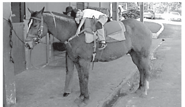
A interação com o cavalo é importante para o sucesso do tratamento