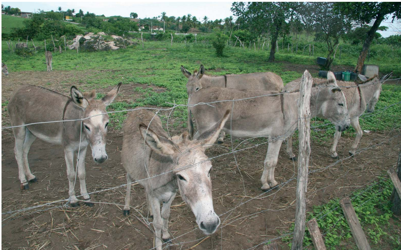
Estatísticas apontam que no período 1966 e 1988 foram exterminados 1,5 milhão de jumentos no Nordeste brasileiro

As estatísticas levantadas por Leitão indicam que entre 1966 e 1988 foram exterminados 1,5 milhão de jumentos no Nordeste do Brasil. A carne, tinha consumo local e internacional. Os maiores consumidores eram o Japão e a Holan-