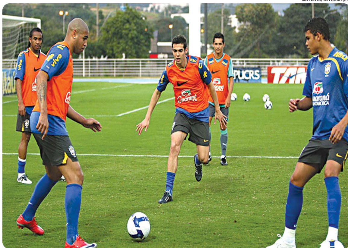
Kaká participou de treinamento e nada sentiu. Sua escalação contra o Peru depende apenas do técnico Dunga

■ No "dia da mentira" a expectativa é que a seleção volte a se exibir como pentacampeã e não encontre dificuldades para vencer o lanterna Peru no Beira Rio