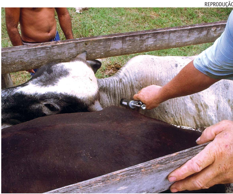
Doses de vacinas podem ser encontradas em farmácias credenciadas