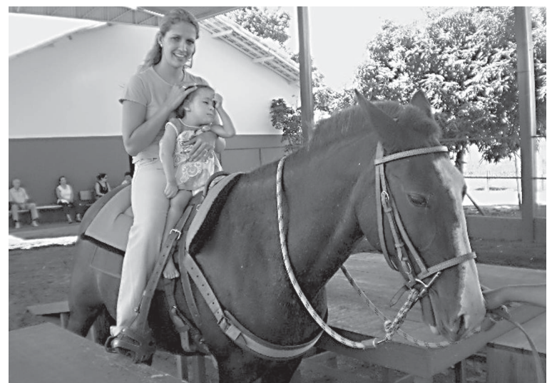
O cavalo serve como agente promotor de ganhos físicos e psicológicos