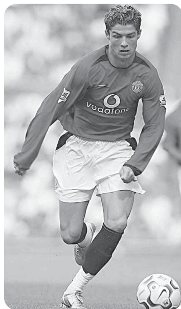
C.Ronaldo, do Manchester aparece em quarto lugar