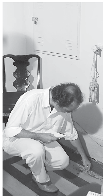
Há problemas até no piso do Palácio

Dando prosseguimento ao trabalho, nas próximas semanas os técnicos do Iphaep vão elaborar um projeto que será levado à apreciação do seu órgão deliberativo. "Tão logo seja aprovado pelo Compec, ele será encaminhado à Suplan, que executará os serviços de manutenção e conservação deste bem, que é tão importante para a Paraíba", disse o diretor do Iphaep.