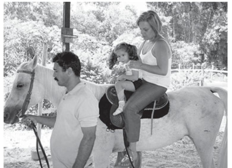
Uma equipe multidisciplinar é responsável pela assistência às pessoas

A equoterapia é um método terapêutico e educacional que utiliza o cavalo dentro de uma abordagem interdisciplinar, nas áreas de saúde, educação e equitação, buscando o desenvolvimento biopsicossocial de pessoas com deficiência e/ou com necessidades especiais. Ela emprega o cavalo como agente promotor de ganhos físicos, psicológicos e educacionais. Esta atividade exige a participação do corpo inteiro, contribuindo, assim, para o desenvolvimento da força, tônus muscular, flexibilidade, relaxamento, conscientização do próprio corpo e aperfeiçoamento da coordenação motora e do equilíbrio. A interação com o cavalo, incluindo os primeiros contatos, o ato de montar e o manuseio final, desenvolve novas formas de socialização, autoconfiança e auto-estima. O praticante de equoterapia é o termo utilizado para designar a pessoa com deficiência e/ou com necessidades especiais, quando em atividades equoterápicas. Nesta atividade, o sujeito do processo participa de sua reabilitação, na medida em que interage com o cavalo.