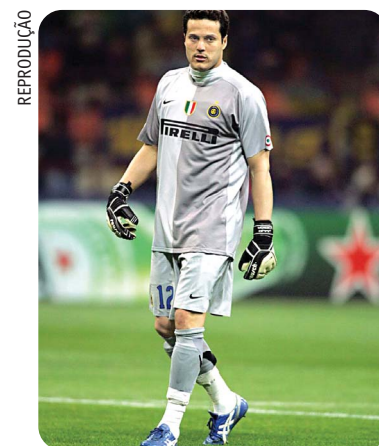
Como na seleção, Júlio César brilha também na Inter de Milão