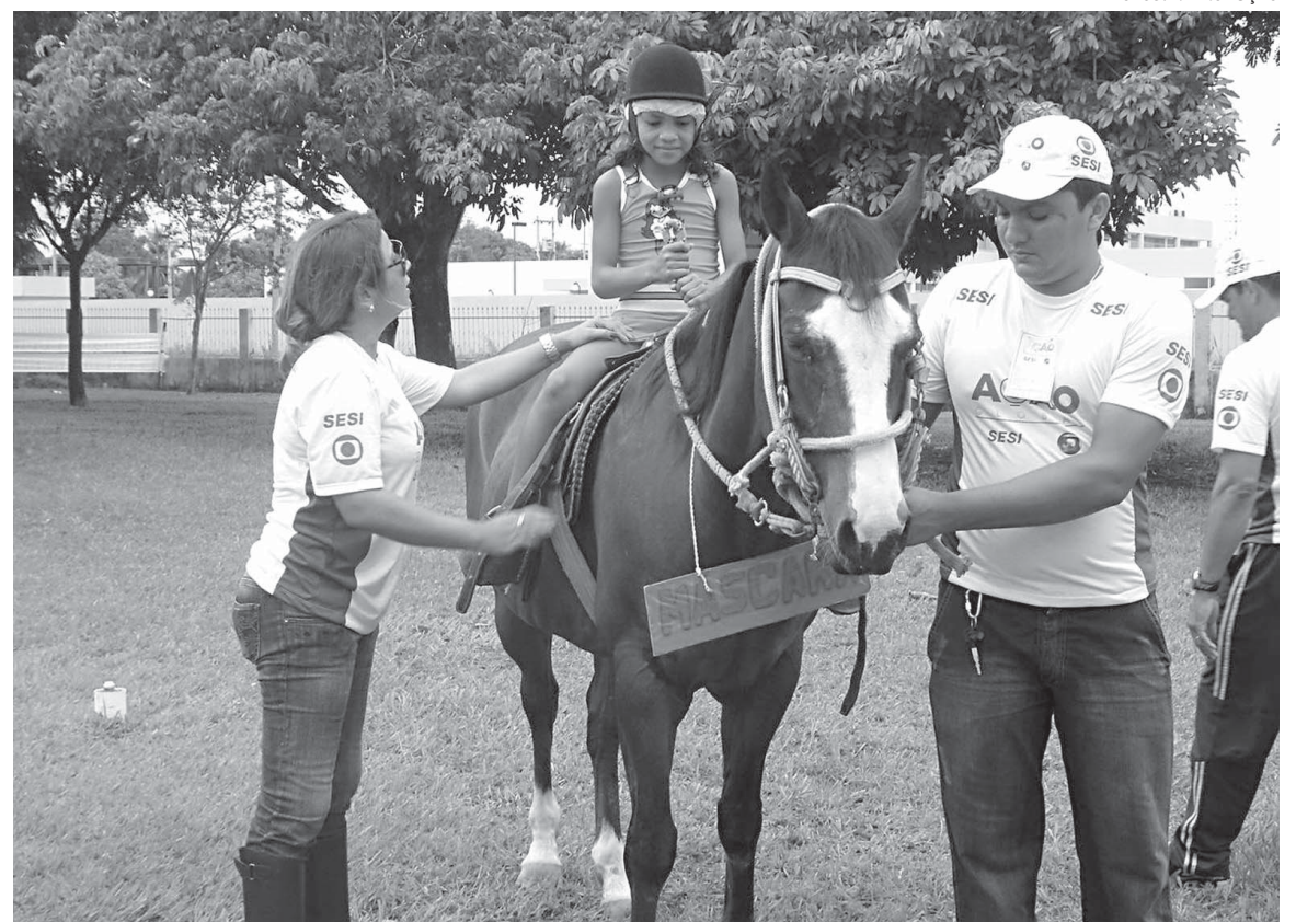
O tratamento busca o desenvolvimento biopsicossocial de pessoas com deficiência ou necessidades especiais

A profissional afirma ainda que a utilização do cavalo, como instrumento terapêutico