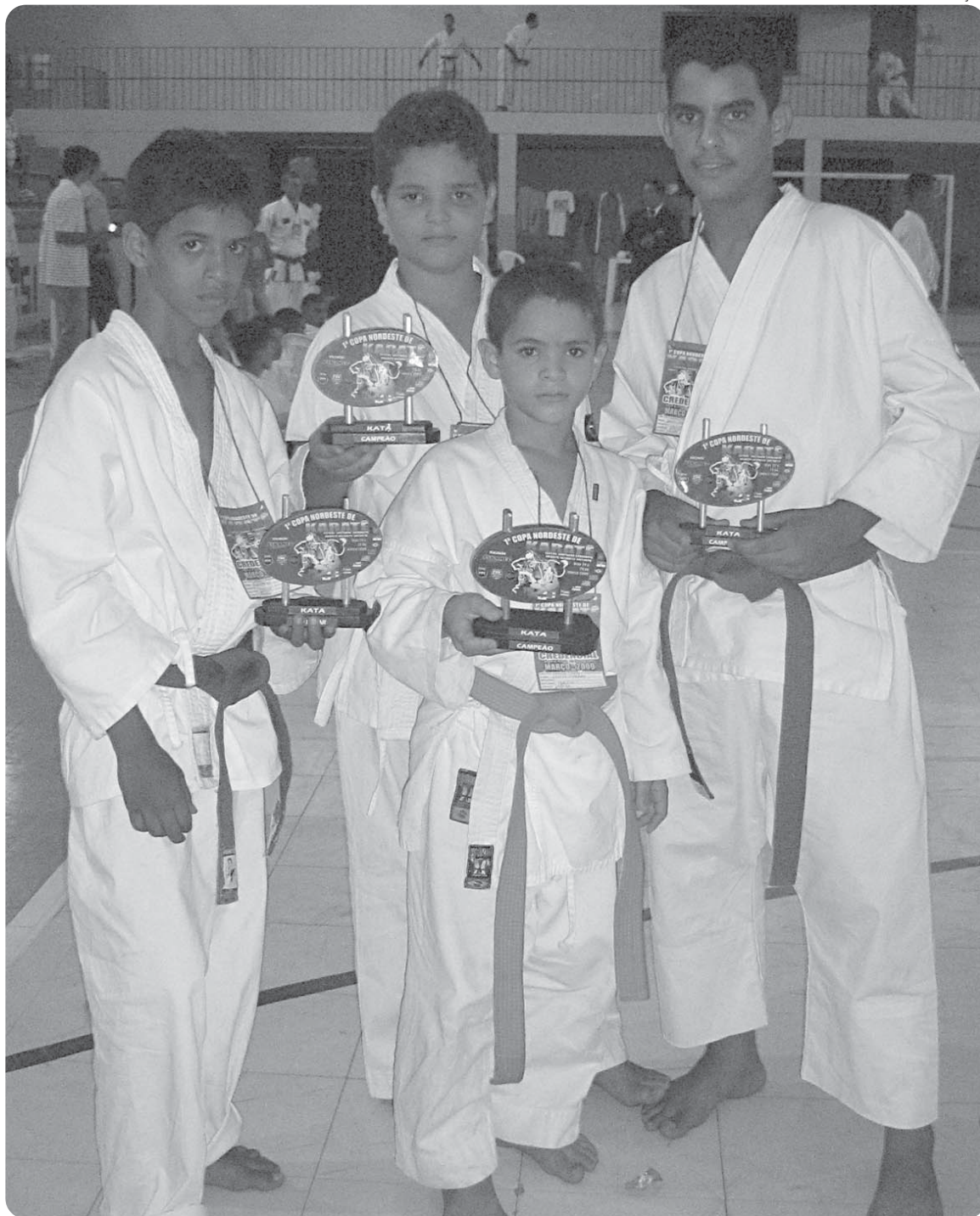
Atletas paraibanos exibem orgulhosos os troféus conquistados no fim de semana pela Copa Nordeste de Karatê