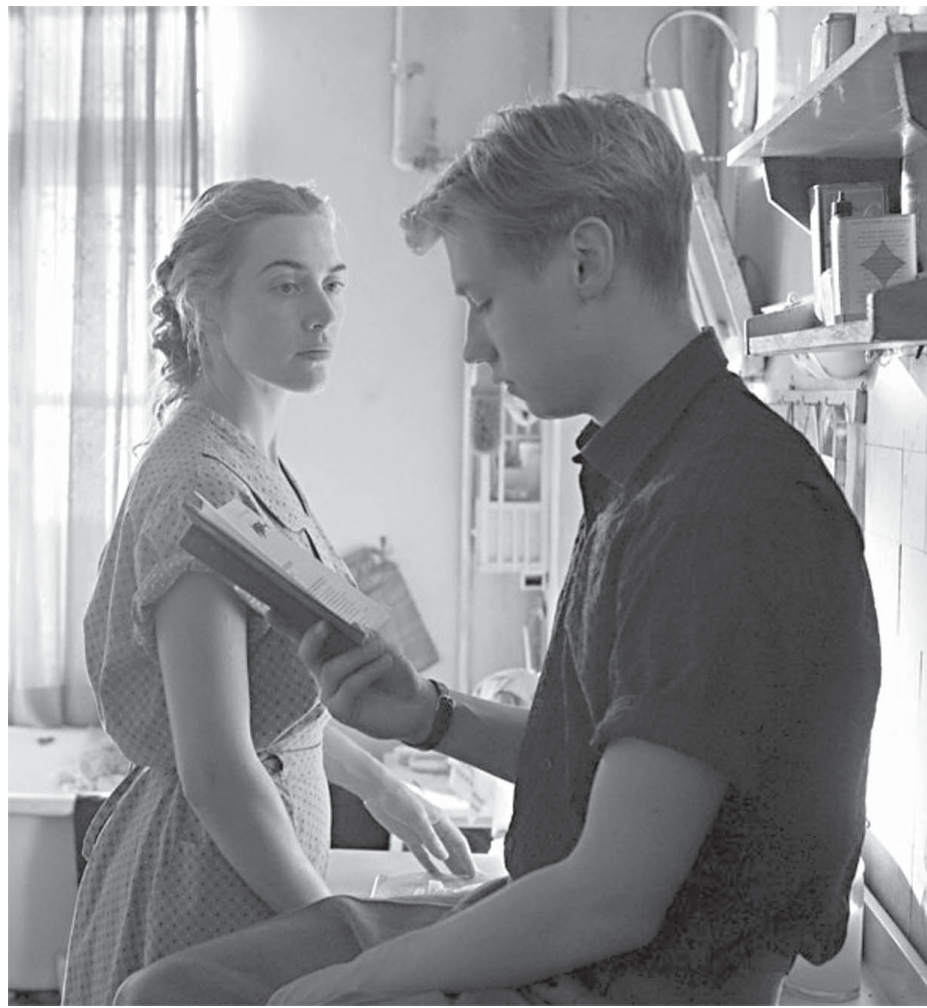
Kate Winslet é a protagonista do filme "O leitor", ainda em cartaz nos cinemas paraibanos