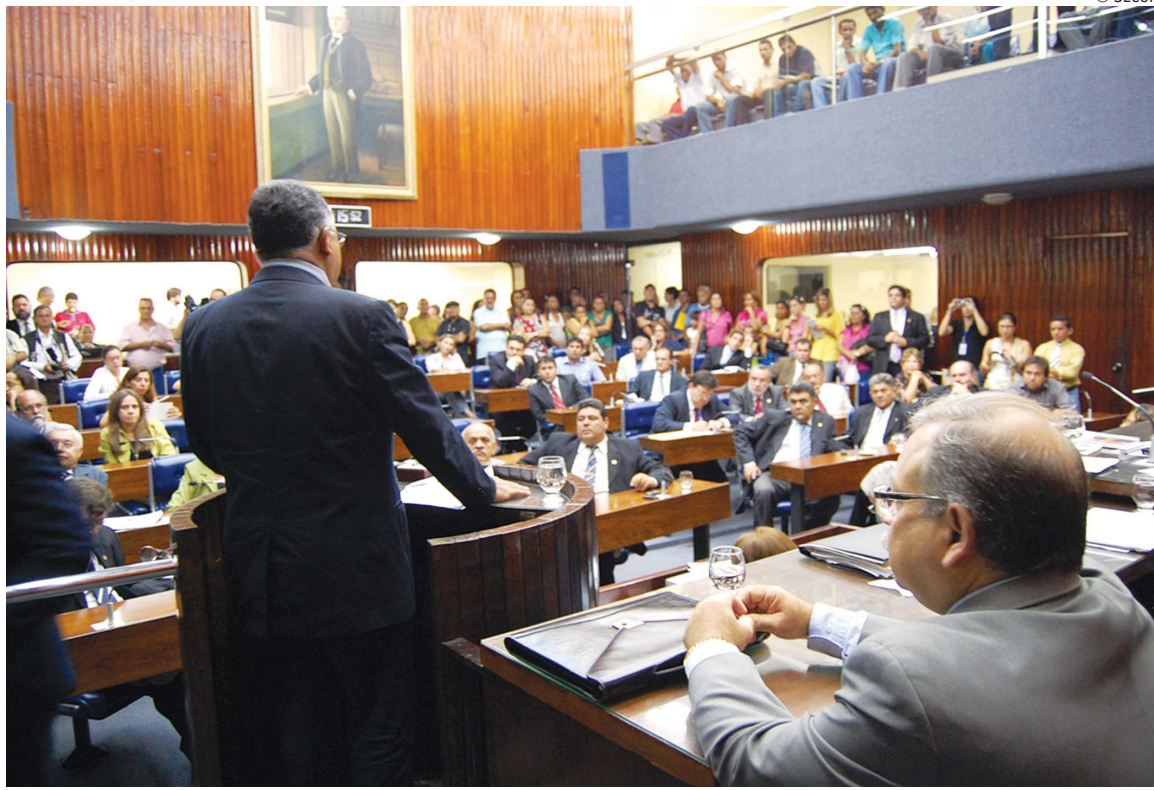
Os secretários participaram de sessão especial realizada ontem no plenário da Assembleia Legislativa do Estado