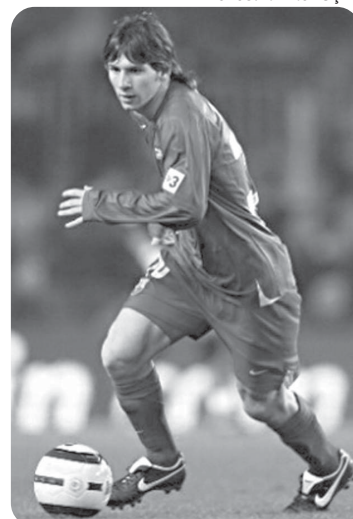
O argentino Lionel Messi figura também na lista dos bem pagos